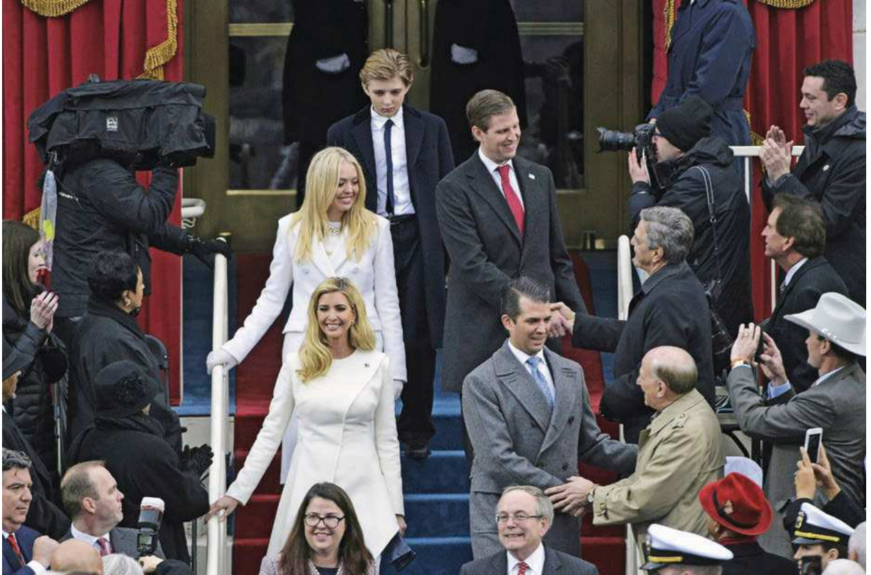
OS FILHOS Do alto, em sentido horário, Barron, Eric, Donald Trump Jr., Ivanka e Tiffany durante a cerimônia de posse

U m novo orgulho nacional vai nos mover, levantar nosso olhar e curar nossas divisões”, disse Donald Trump em seu discurso de posse, na sexta-feira 20, em Washington. As palavras do 45º presidente da maior democracia do mundo não condizem com seus atos. Durante toda a campanha presidencial, e também nos meses que se seguiram à sua eleição, Trump explorou a desunião dos cidadãos e desprezou os princípios democráticos — tanto os explícitos, contidos nas leis do país, quanto os implícitos, construídos ao longo de décadas com base no respeito entre adversários políticos.