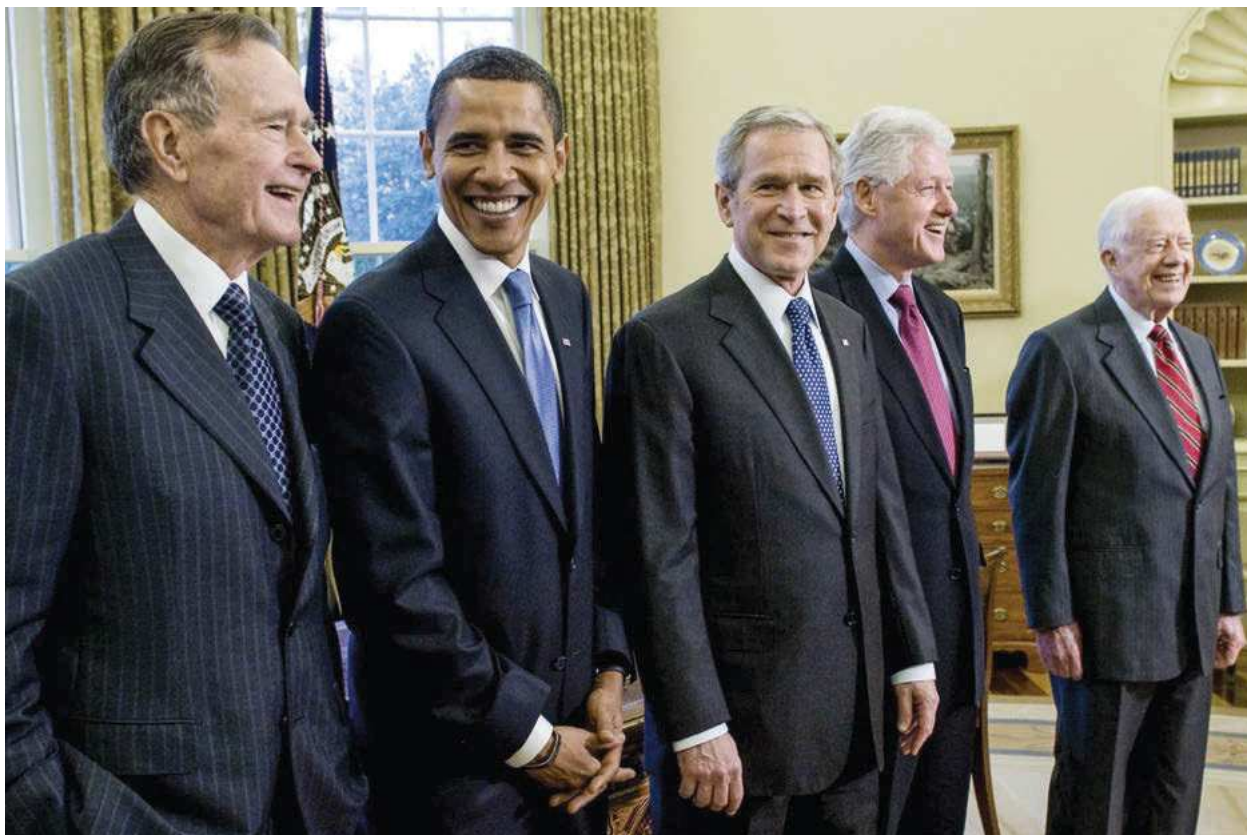
TURMA DOS EX George H.W. Bush, Obama, George W. Bush, Bill Clinton e Jimmy Carter na Casa Branca, em 2009